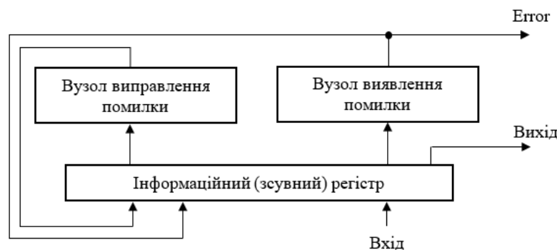
Рисунок 1 – Схема функціонального контролю для одиничного позиційного коду

Крім того, одиничний позиційний код має просте синдромне декодування за аналогією з кодом Хеммінга [15], оскільки відхилення у позиціях (розрядах) сформованого синдрому у порівнянні з правильним синдромом вказує на конкретну помилкову позицію у поточному кодовому слові. Цю властивість одиничного позиційного коду доцільно використати не тільки для виявлення, але й для виправлення помилки. Для цього у статті [18] запропоновано схему функціонального контролю для одиничного позиційного коду (рис. 1).